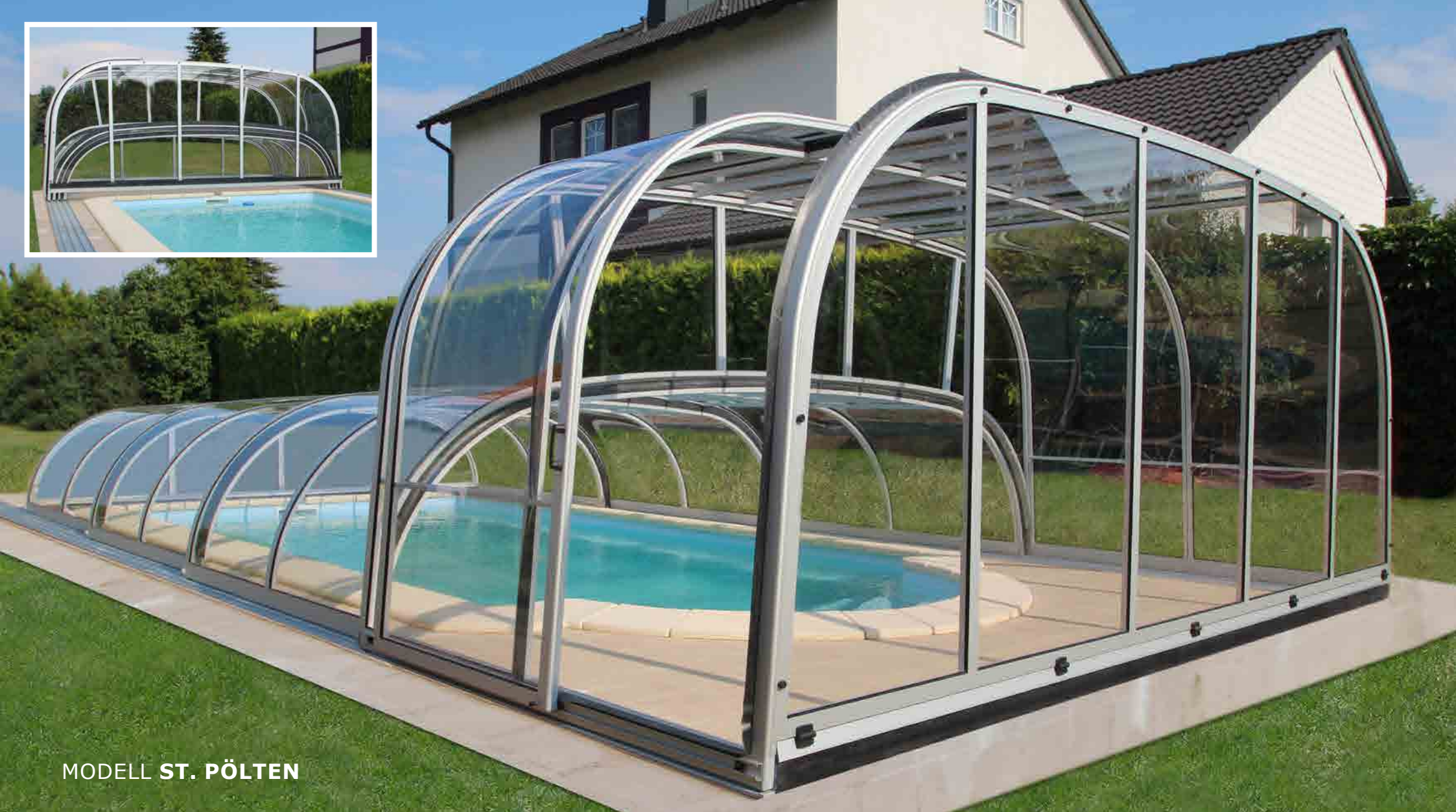
MODELL ST. PÖLTEN

Ausgereifte Details der SONNENKOENIG ® Schwimmbadüberdachung bieten hohen Bedienungskomfort bei bestmöglicher Sicherheit.